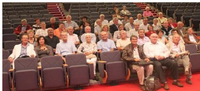
ESCIL 1971 visite l'école, ici dans le grand Amphi